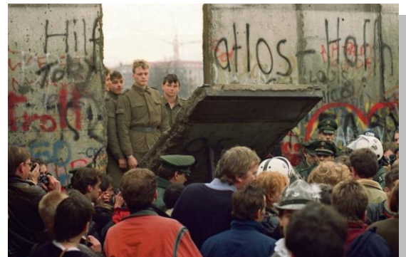
[Chute du mur de Berlin filetype:jpg]

2018 : enjeu : 24e Conférence climat de l'Onu (COP24) à Katowice (Pologne) fin 2018.